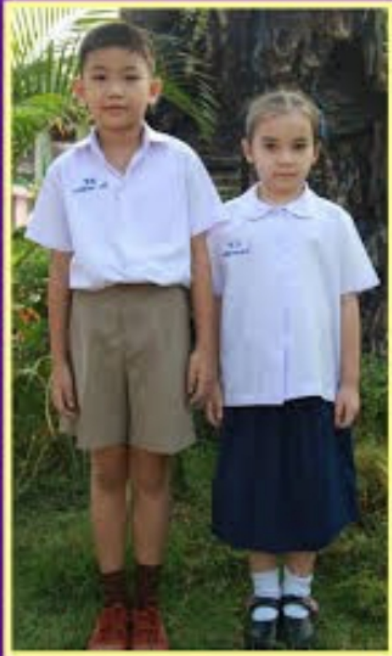
ชุดนักเรียนระดับประถมศึกษา